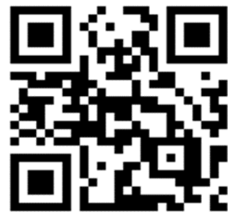
サイト QR コード